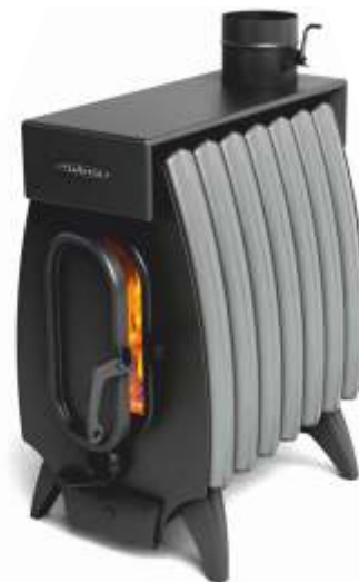
Battery fire 7 Light