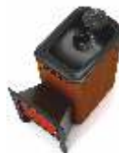
Angara 2012 Keskklassi puuküttega suletud kerisega saunaahi