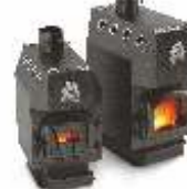
Gymnasist, Student Engineer Kõvakütite õhku soojendavate katelde joonlaud