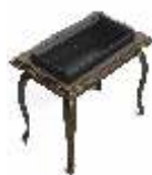
Jardin Elegantne puuküttega grill